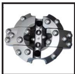
2 ЛОПАСТИ T115 - T165