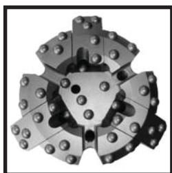
3 ЛОПАСТИ T190 - T315, T455, T610